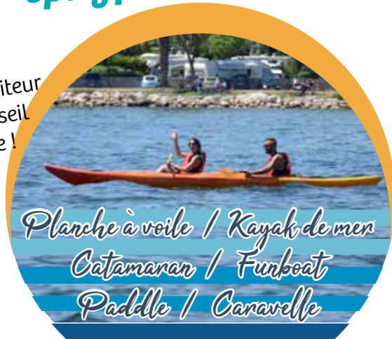
Planche à voile / Kayak de mer Catamaran / Funboat Paddle / Canavelle