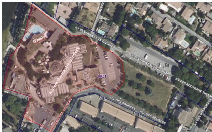
Fig. 2 : Emprise à déclasser parcelle BD 31

L'opération de revitalisation du secteur avec une extension du complexe O'balia, la construction d'un hôtel et un réaménagement des espaces publics et des zones de stationnement, a fait l'objet de plusieurs informations de la population depuis 2018 ( publications jointes en annexe au dossier d'enquête publique ). Elle recouvre une emprise à déclasser de 16 026 m 2 de la parcelle BD 31, entre l'avenue des Sources et l'avenue des Nouveaux Thermes.